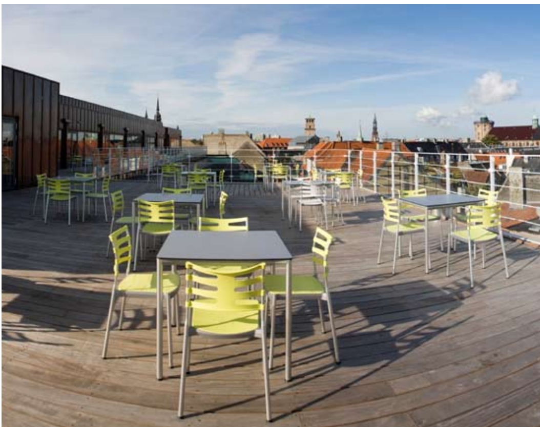
Üleval: Zeta laud Brøderna Andersen'lt ja Ice baaripukk Fritz Hansen'lt Vasakul: Ice laud ja tool Fritz Hansen'lt