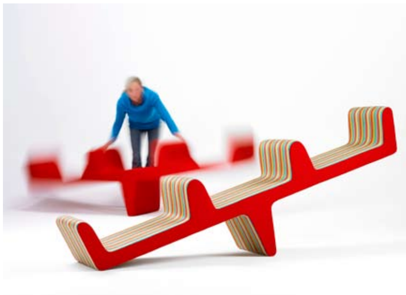
Erik Jørgensens Seesaw